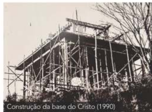
Construção da base do Cristo (1990)

O Morro Itatiaia e todo o seu complexo, recebe turistas de todo o Brasil, e deve ser motivo de orgulho de todo o santarritense que ama a sua cidade.