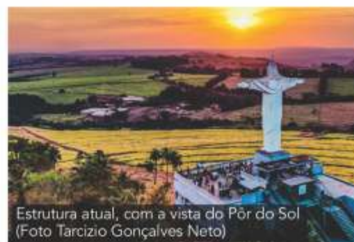
Estrutura atual, com a vista do Pôr do Sol