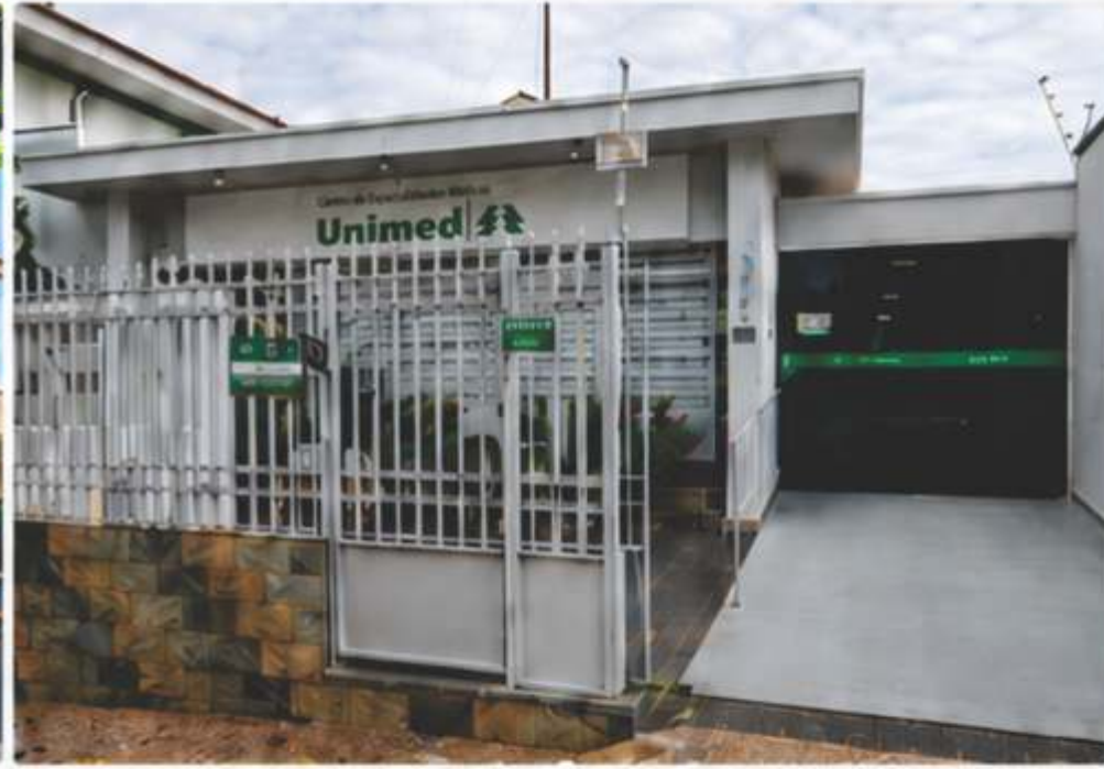
CEM / Especialidades Médicas