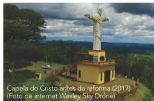
Capela do Cristo antes da reforma (2017)